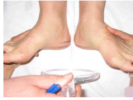
Wir können sehen, dass die Wirbelsäule sich aufgerichtet hat, das Becken korrigiert und der Unterschied der Beinlängen ausgeglichen worden ist.