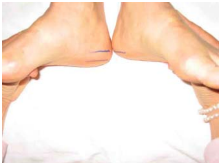
Auf Grund der Schiefe der Wirbelsäule und des Beckens sehen wir, dass die Beinlängen verschieden sind, wenn man diese im Sitzen oder Liegen mit ausgestreckten Beinen misst.