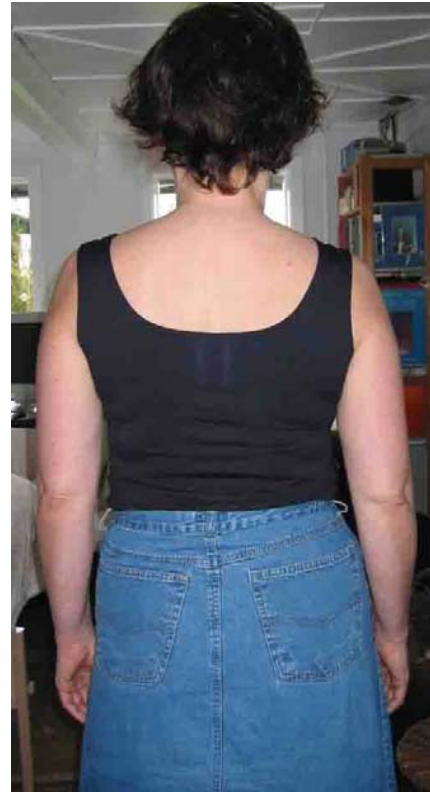
Schulterblätterunterschied ausgeglichen Beinlängenunterschied ausgeglichen