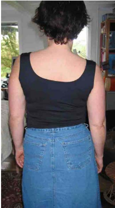
Schulterblätterunterschied ca 1½ cm Beinlängenunterschied ca 1 cm